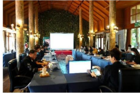
จัดทําโดย งานประชาสัมพันธ์ฯ ฝ่ายการตลาดและประชาสัมพันธ์