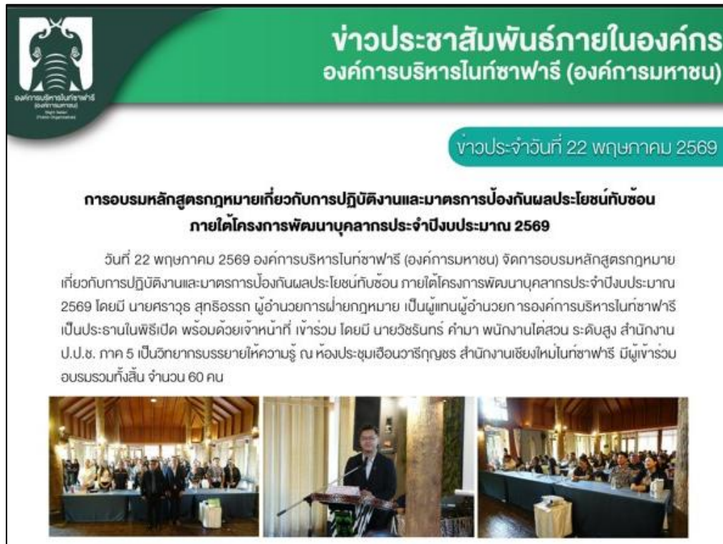
องค์การฯ ได้จัดการอบรมหลักสูตรกฎหมายเกี่ยวกับการปฏิบัติงานและมาตรการป้องกันผลประโยชน์ทับซ้อน ภายใต้โครงการพัฒนาบุคลากรประจำปีงบประมาณ พ.ศ. ๒๕๖๙