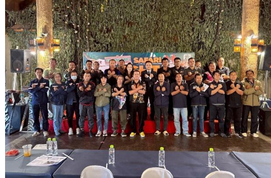
องค์การฯ ได้จัดการอบรมหลักสูตรการพัฒนาจริยธรรมสำหรับเจ้าหน้าที่ของรัฐ ขององค์การบริหารไนท์ซาฟารี (องค์การมหาชน) ภายใต้โครงการพัฒนาบุคลากรประจำปีงบประมาณ พ.ศ. ๒๕๖๙