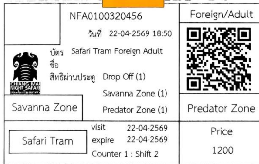
ภาพตัวอย่างบัตรปรินจากจุดจำหน่ายบัตร