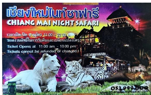
ภาพตัวอย่างบัตรปรินจากตู้ลูกค้าสัมพันธ์