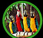
นกแก้วคอว