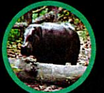
อึนปิ้งแคระ