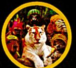
แค้งมลายู